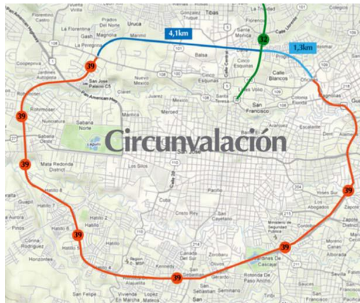
Figura No.1. Ruta 39-Circunvalación San José (en azul, tramo “Circunvalación Norte”).