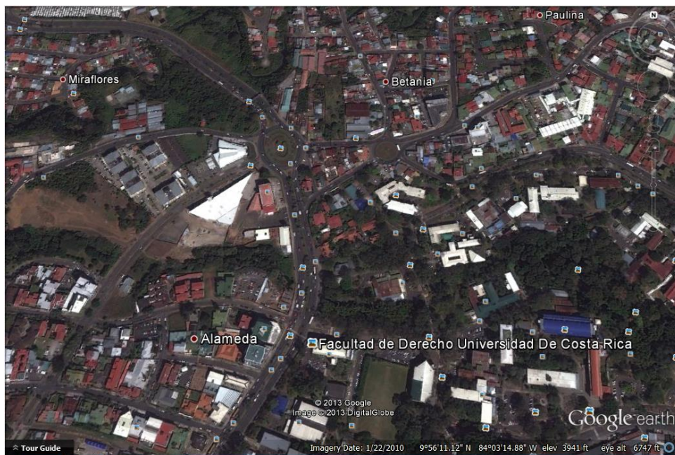
Foto No.2. Vista aérea intersección Facultad de Derecho Universidad de Costa Rica y la Rotonda de la Bandera